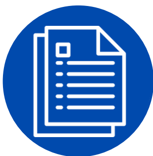
Envio da Documentação