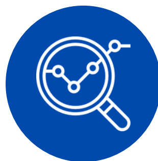
Análise da SEGER