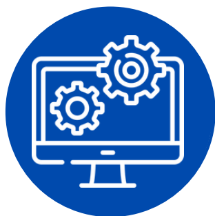
Acesso ao Sistema Digital